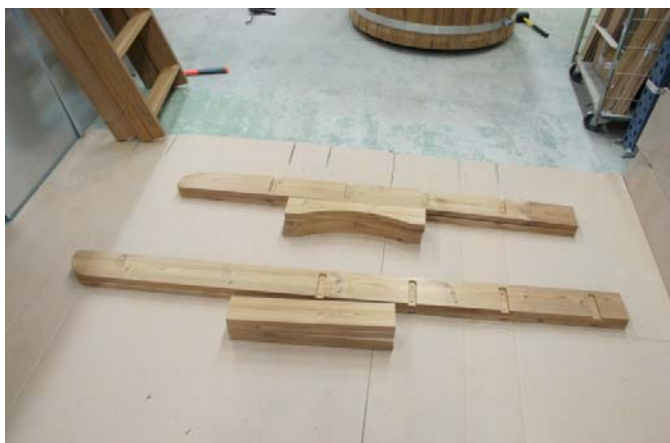
Kuvassa näkyy osat.