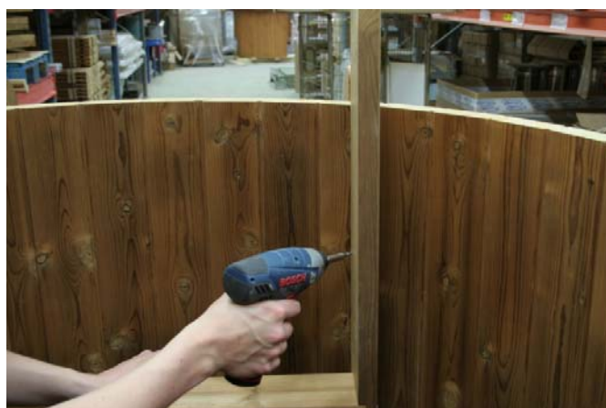
Ruuvaa kiinni sisäpuolinen tikapuu kolmella ruuvilla per sivu.