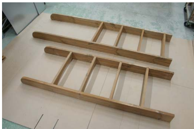
Sovita osat yhteen ja ruuvaa kiinni mukana tulevien ruuvien ja ”prikkojen” kanssa.