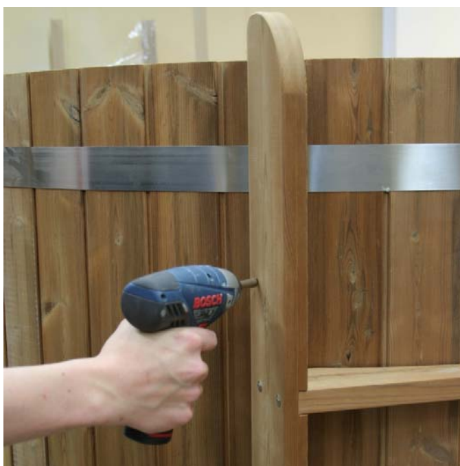
Ruuvaa kiinni ulkopuolinen tikapuu kolmella ruuvilla per sivu.