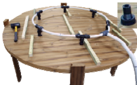
Ilmaventtiilit ruuvataan kiinni pohjaan

Letku nostetaan ja kiinnitetään 3 cm yläreunasta niin vettä ei pääse pumppuun.