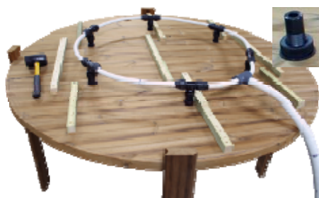
Die T-Stücke werden auf die Luftventile geschraubt/gedrückt.

Der Schlauch läuft an der Seite des Hottubs hoch, so das kein Wasser in die Luftpumpe eindringen kann.