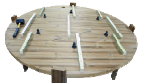
Die Luftventile werden in den Fassboden geschraubt.

Eine Abdeckung (Zubehör DTHS) bedeckt und schützt den Schlauch für die Luftpumpe.